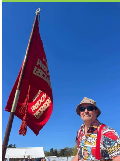
1.Maj i Fælledparken

Som nyansat kan du stå i den situation, at du ikke har optjent ferie og skal derfor søge om feriedagpenge hos lærernes a-kasse. Har du spørgsmål, så kontakt din TR eller kredsen.